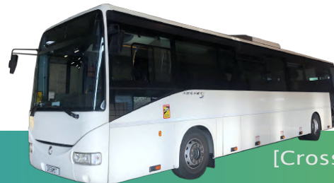
[Crossway] [...Votre véhicule...]